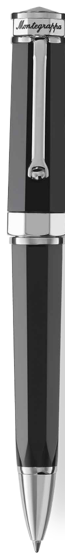
SFERA A ROTAZIONE TWIST ACTION BALLPOINT PEN