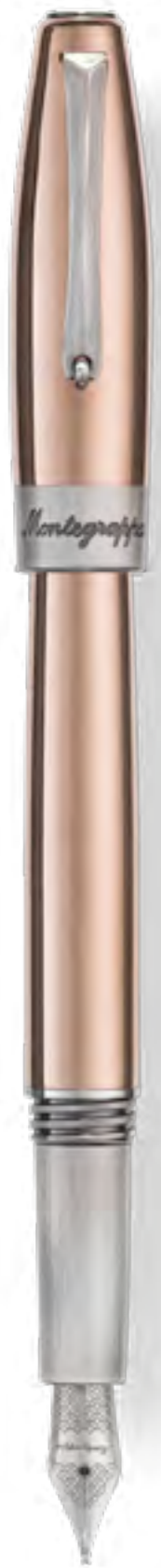
Fountain Pen ISFSH_CU