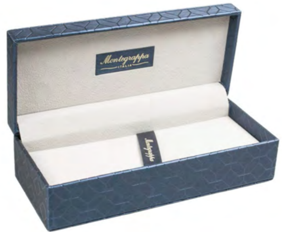
Standard Packaging IKSDASIC