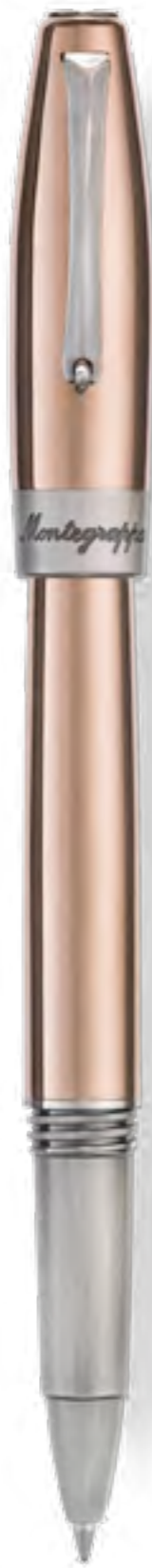
Rollerball Pen ISFSHRCU