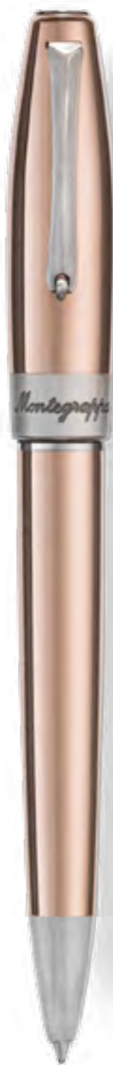
Ballpoint Pen ISFSHBCU